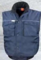
ZIP OUT SLEEVES